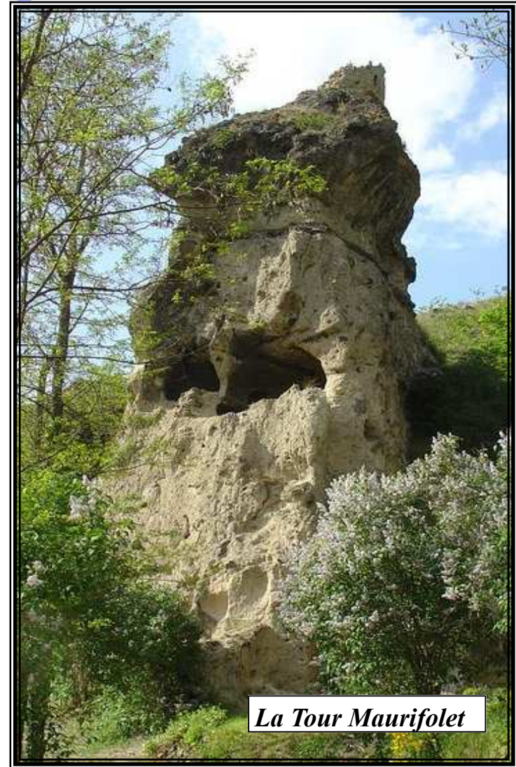
La Tour Maurifolet

Un véritable Village Troglodytique : Le Village des Roches